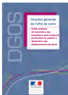
Guide pratique édité par la DGOS

Il est difficile de se repérer dans la jungle de ces frais supplémentaires qui ont vu le jour, principalement dans les établissements privés et qui peuvent varier d'une région à l'autre, d'un établissement à l'autre... D'autant que ces facturations se cachent parfois sous des noms qui font penser qu'elles sont officielles !